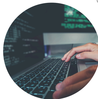
ハイレベルなエンジニア